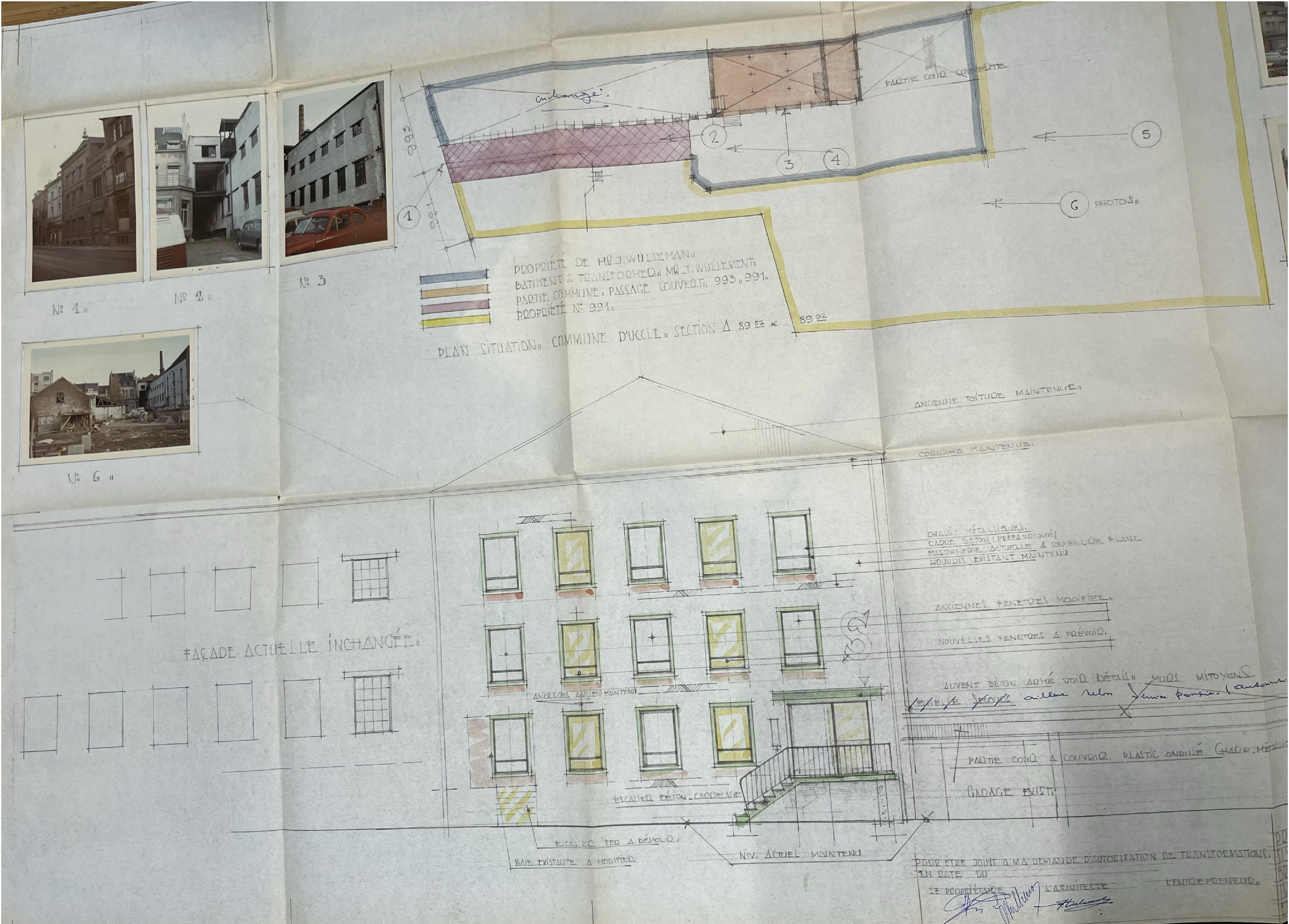
FACADE NORD Situation de droit Permis d'urbanisme de 1969