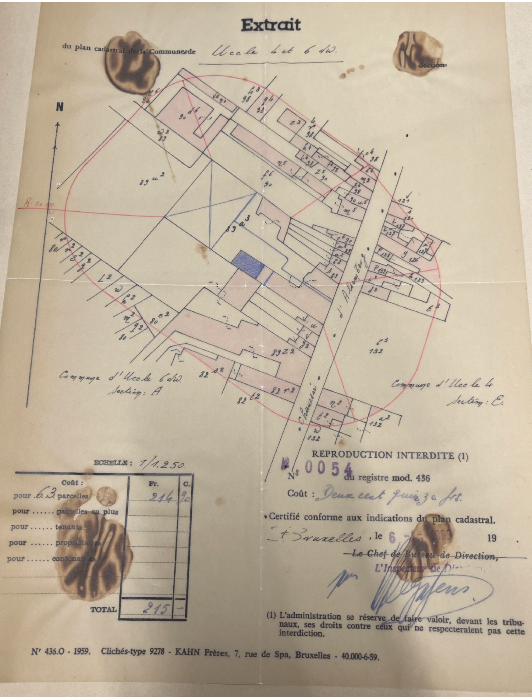
PLAN D'IMPLANTATION 1/1250 Situation de droit Permis d'urbanisme de 1969